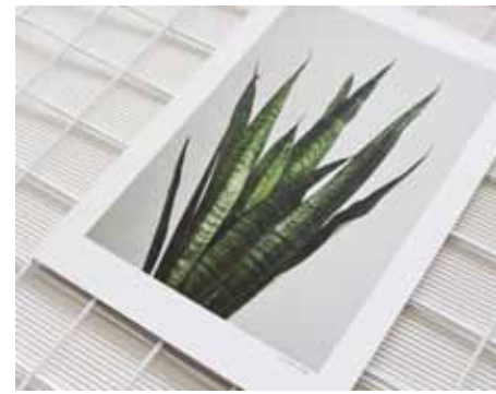
Poster | Puntigepracht