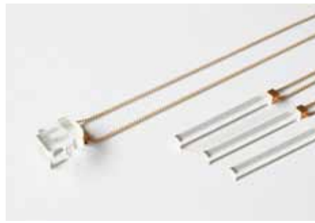
Ketting | 'Crystals' 1.1 Turina Jewellery