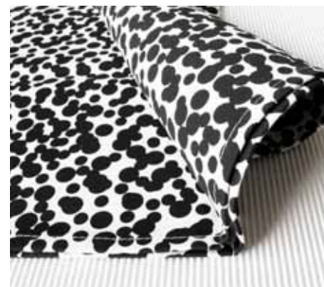
Theedoek | 'Dots' zwart