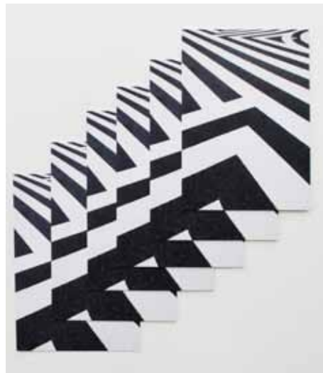
Postcard | follow your own path'