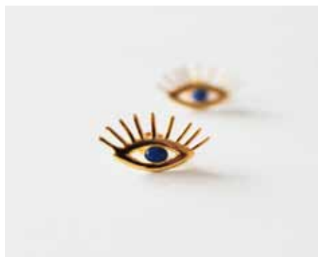
Evil eye earrings | Goud

ken een platform bieden om te kunnen groeien. Naast werk van anderen verkoop ik ook eigen werk. Four Stories is naast een online concept store ook een inspiratie platform. Met het beeld dat ik voor elk thema maak wil ik een verhaal vertellen en de bezoeker hierin meenemen.