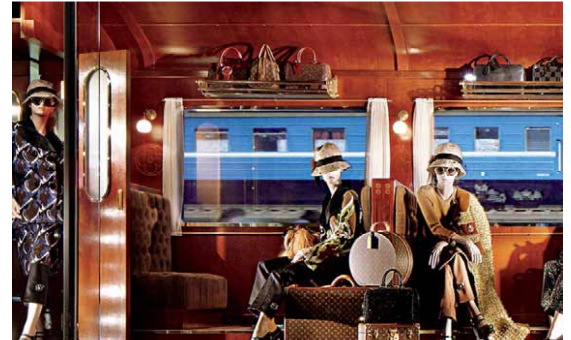
Louis Vuitton aan de Champs Elysees in Parijs

Een recent voorbeeld is het in samenwerking met het Rijksmuseum uitgegeven boek 'Rijks, Masters of the Golden Age'. Gepositioneerd als high-end luxe eerbetoon aan de meesterwerken in het Rijksmuseum in de vorm van 'unique art edition' en 'limited edition' compleet met teksten van 'toonaangevende hedendaagse denkers' en eerste klas materialen die uitstralen dat het om een bijzonder en schaars object gaat, oftewel een 'goedkoop kunstwerk'. De witte handschoentjes die moeten worden gebruikt voor het bladeren versterken de indruk dat het om kunst gaat, hoewel de initiatiefnemers van het boek die minder belangrijk lijken te vinden. Het Van Gogh-museum biedt 3D geprinte reproducties aan in gelimiteerde oplage.