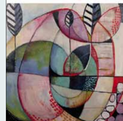
Kunstwerk 'Oorsprong' op de cover is van Cynthia Jagtman