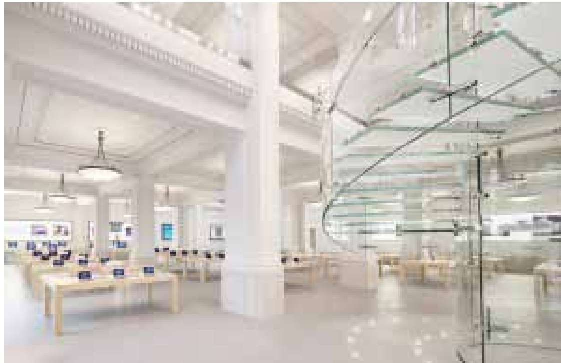
Apple store in het Hirschgebouw aan het Leidseplein