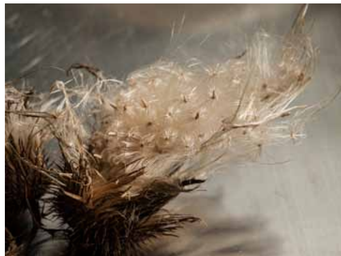
28 Xandra Richters is een nieuwe kunstenaar op onlinekunstenaars.nl